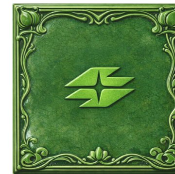
Entwurf Wiener Netze Fliese