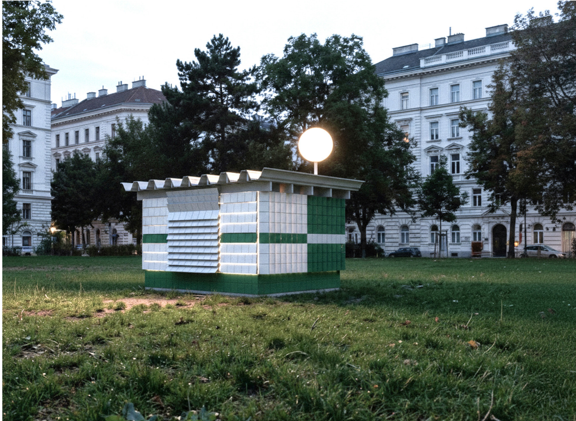
Perspektivische Darstellung Stadtraum